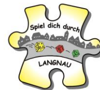
Spiel dich durch..., Langnau