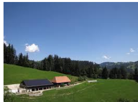
Förderung Solarstrom Emmental