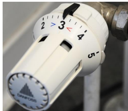
Thermostatventil zur Regelung der Raumtemperatur

In kaum gedämmten Gebäuden kann es hingegen nötig sein die Temperaturen etwas höher einzustellen. Dies weil die Kälteabstrahlung der schlecht isolierten Wände durch eine höhere Raumluft-Temperatur kompensiert werden sollte, damit die Bewohner nicht frieren und sich behaglich fühlen. Die höheren Temperaturen vermindern ebenfalls das Risiko für Feuchtigkeitsprobleme und aus denselben Gründen sollte man jeweils auch für einen frühzeitigen Heizbeginn sorgen. Nachhaltiger und sinnvoller wäre es jedoch die Wärmedämmung zu verbessern.